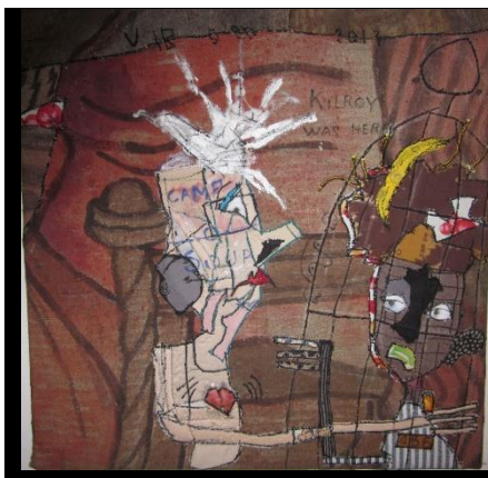
Andy Warhol og Basquiat 60 x 60

Jeg er autodidakt kunstner - min maling er stof, tråd, bånd, snor, lidt glimmer, måske en knap, og min pensel er en symaskine. Disse materialer har jeg arbejdet med i 20 år og skabt billeder/stofcollager, der er surrealistiske i udtrykket. For mig er en restekasse med tekstiler og afklippede bånd fyldt med gode historier, der venter på at blive syet op på et lærred, som måske kan være et tidligere teatertæppe, et draperi.