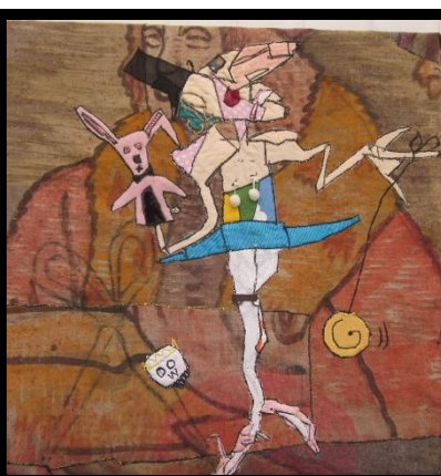
H.C. Andersen danser ballet 60 x 60