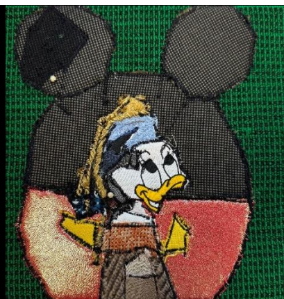
Pige med perleøring 20 x 20