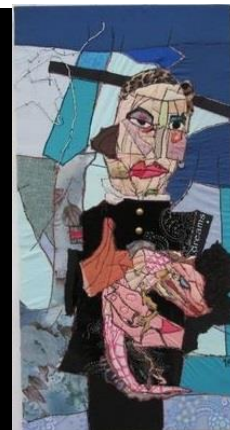
Catwalk 40 x 50